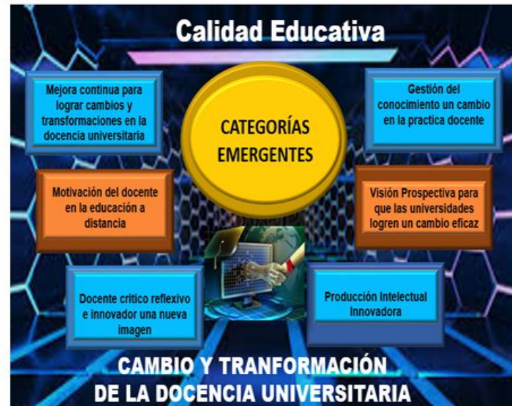
Figura 6. Red conceptual de Categoría Emergentes

universitaria está abierta a a toda transformación que se adecuen