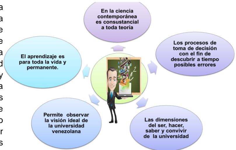
Figura 5. La praxis creativa como arquitectura del conocimiento

producto de una reflexión y comprensión de los significados de la esencia experiencial específica de sus actores sociales, para ayudarles a cambiar.