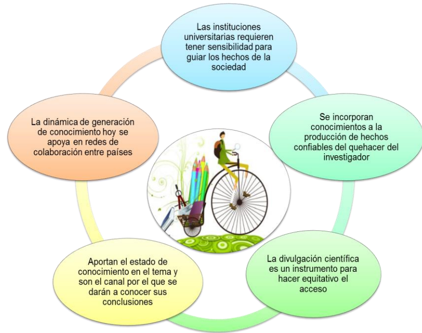
Figura 6. Producción y difusión del conocimiento en la praxis creativa del profesor universitario.

ampliado los años de permanencia en los centros.