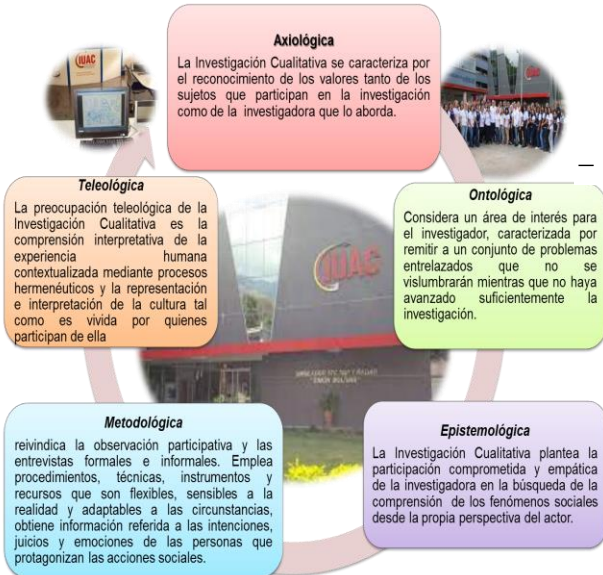
Figura 1 Matriz Epistémica de la Investigación

Universitaria Instituto Universitario de Aeronáutica Civil (IUAC), ubicado en el Castaño, Maracay; es el objetivo de este estudio que se centra en ofrecer a los docentes, una estructura de caminos heurísticos en la construcción del conocimiento inmerso en las siguientes dimensiones: