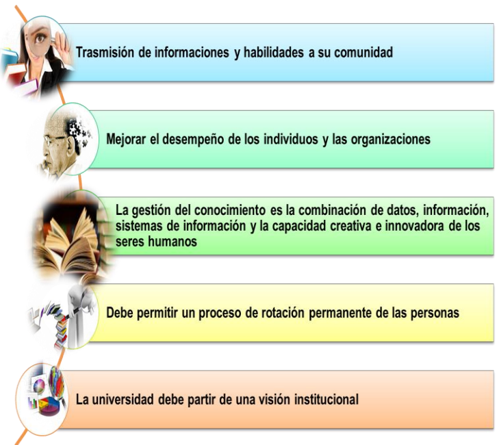
Figura 3. Gestión del Conocimiento Universitario

mundo cambiante y exigente en que vive el hombre hoy en día demanda de él que dirija la mirada hacia su propio ser, hacia su capacidad de innovar, modificar y generar transformaciones positivas para no sólo tener una mejor calidad de vida, sino también, para abrir su mente hacia nuevas formas de pensamiento, aún muy disímiles con el suyo.