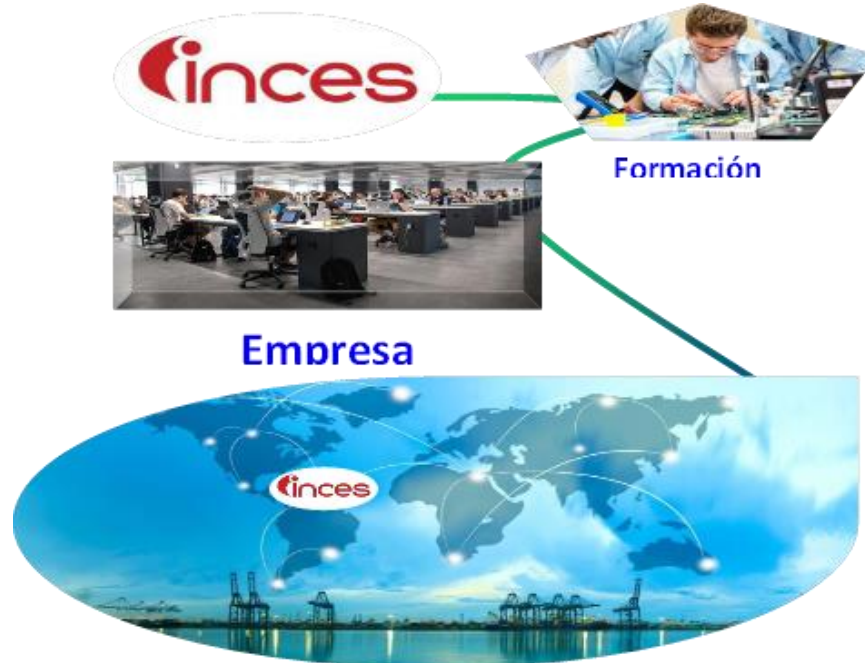
Figura Nº 4. Formación Profesional en un mundo Globalizado.

Sin dejar a un lado el tema de la Cultura Laboral la cual va como parangón del desarrollo productivo, como se muestra en la figura 5. En este sentido, una resignificación de la formación profesional en el INCES conlleva a una inmersión en la globalización para formar efectivamente en ocupaciones que coadyuven al crecimiento interno de las empresas, pero que a su vez le permita al participante crecer profesionalmente dentro de ellas para poder optar a los ascensos por jerarquía y que se traduzcan en protagonistas de una cultura laboral efectiva, con este constructo se dan pasos hacia la vinculación entre la cultura laboral y el desarrollo productivo, necesariamente se debe estrechar lazos entre el INCES/Empresa que tributen al desarrollo productivo, a través de la formación técnica profesional.