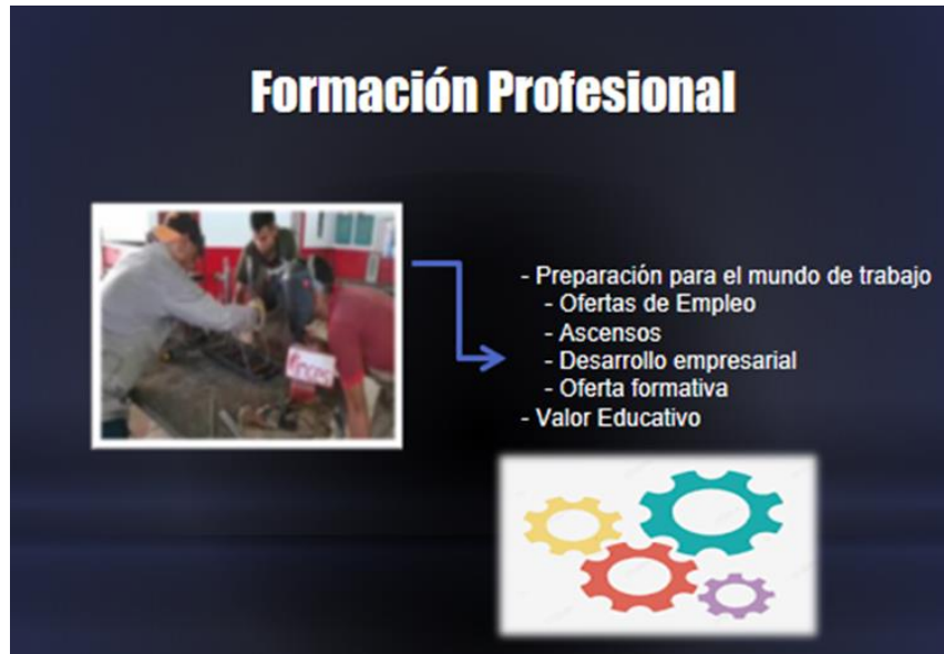
Figura Nº 1. Formación Profesional.

Seguidamente se encuentra la segunda categoría: Cultura Laboral, mostrada en la figura 2, y vista como un conjunto de aptitudes y conocimientos del trabajador que lo identifican plenamente con la organización, lo cual se ha visto afectada por la nula actualización de contenidos y puesta en marcha de técnicas que entrelacen las formación, además del tema de la diáspora que ha significado una fuga considerable de talentos.