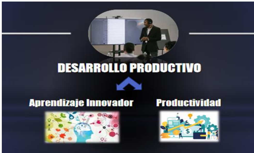
Figura Nº 3. Desarrollo Productivo.

En una tercera categoría, tal como se muestra en la figura 3, se ubica el Desarrollo Productivo: donde se evidencia la demanda de desarrollar en la institución un aprendizaje innovador a fin de incrementar la productividad en el sector empresarial, con la obtención de resultados positivos en el tiempo y con los recursos previstos.