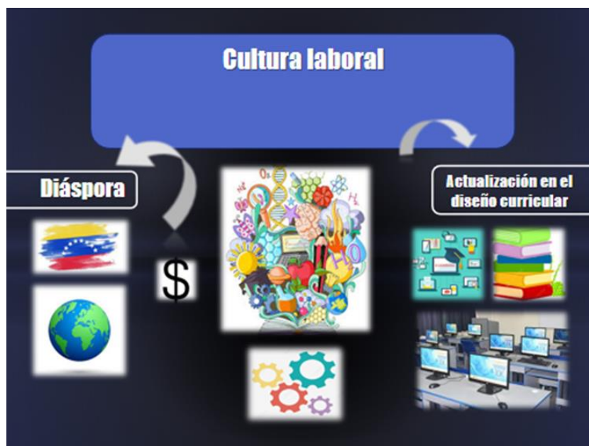
Figura Nº 2: Cultura laboral.

Seguidamente se encuentra la segunda categoría: Cultura Laboral, mostrada en la figura 2, y vista como un conjunto de aptitudes y conocimientos del trabajador que lo identifican plenamente con la organización, lo cual se ha visto afectada por la nula actualización de contenidos y puesta en marcha de técnicas que entrelacen las formación, además del tema de la diáspora que ha significado una fuga considerable de talentos.