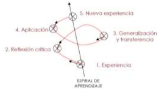
Lema (2009 a )

En el mismo orden se presenta el modelo de procesamiento de experiencia en el cual Kolb (1984b) asocia: experiencia concreta (EC); observación reflexiva (OR); conceptualización abstracta (EA); y experimentación activa (EA), de cuyo conexo derivan los cuatro estilos de aprendizaje propuestos, se entiende que el proceso sensible vivencial y el socio constructivo se conjugan en una ordenación permanente.