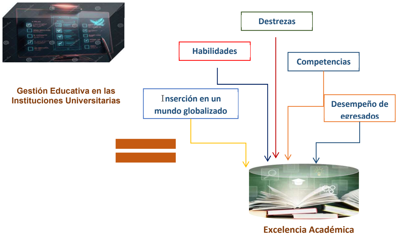
Figura 4. Relación entre la gestión educativa y la excelencia académica en las instituciones universitarias.

Es por ello que, el apoyo institucional tiene como función proporcionar las herramientas, recursos y estrategias concebidas como parte de las acciones internas que promuevan las labores educativas y administrativas inmersas en el sistema educativo de manera que su accionar interno trascienda extramuros y fortalezca las relaciones con otras organizaciones recordando que proveen a la sociedad en general, ver figura 4, dado que, abarca la empresa pública y privada de los profesionales que requiere para su funcionamiento efectivo y que se traduce en desarrollo.