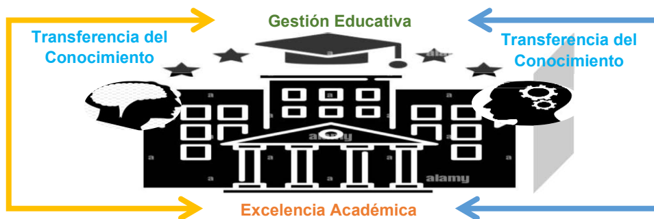
Figura 1. Categorías emergentes producto de la triangulación de la visión de los sujetos sociales (Facilitadores y Triunfador de la Misión Sucre).

Para una mayor comprensión del fenómeno estudiado se organizó la información en función de las cuatro (04) interrogantes dadas a los actores sociales, generando para ello tres matrices. En este sentido, emergieron tres categorías: transferencia de conocimiento, gestión educativa y excelencia académica, tal y como se aprecia en la figura 1.