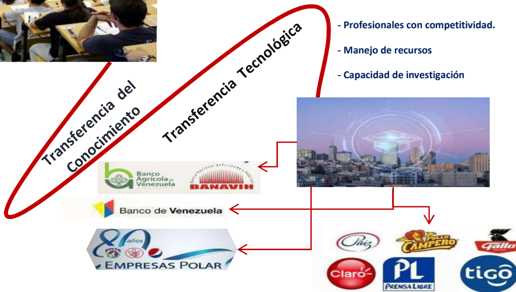
Figura 2. Perspectiva del proceso evolutivo de las instituciones universitarias ajustadas a los procesos tecnológicos producto de la globalización.

En este punto prevalece, que una gestión educativa óptima es la que provee a la sociedad en donde está inmersa, profesionales capaces, competentes, críticos que son el producto de un manejo eficiente de recursos, estrategias, herramientas y políticas orientadas a dar respuesta a las necesidades de un país, por lo que, el desarrollo de los pueblos tal y como lo establecían teóricos como Álvarez (2019) descansaba en el