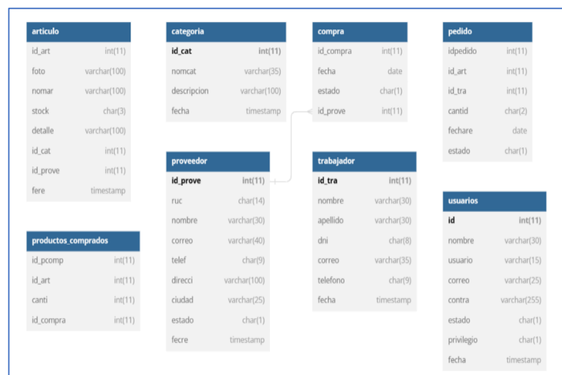
Figura 2. Modelo físico de datos.

En la figura 2, se puede observar la información básica y esencial de la documentación del sistema de inventario, categorizada en artículos, usuarios, productos comprados, proveedor, trabajador, pedido, compra, categoría.