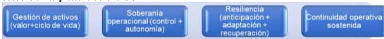
Figura 1 Secuencia interpretativa del análisis