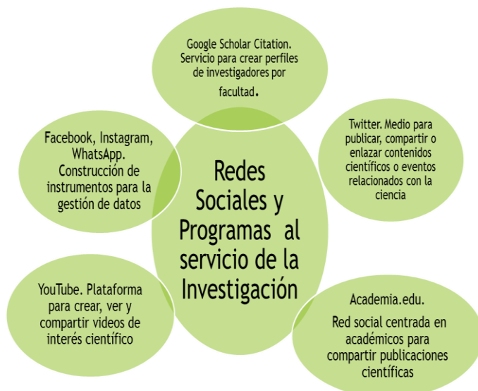
Figura 1. Las TIC en la investigación en pregrado

En tal sentido a nivel de pregrado las distintas facultades pueden crear grupo de investigadores e indexarlas a esas redes. Algunas disponibles y de gran utilidad serian; Google Scholar Citation, como servicio gratuito para crear un perfil de investigadores de esa facultad, Twitter como medio para publicar, compartir o enlazar contenidos científicos o eventos relacionados con la ciencia a diferentes audiencias.