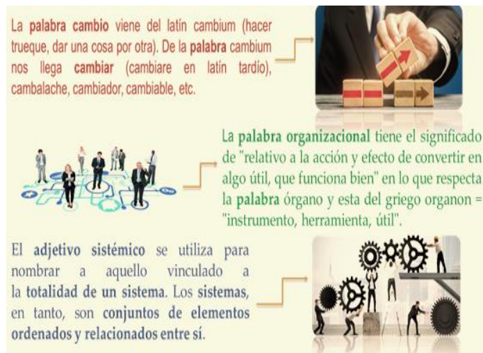
Figura 2. Etiología de las palabras cambio, organizacional y sistémico

se debe modificar el modo de cambiar, y aportan los resultados de estudio de diversas organizaciones sujetas a cambio deben asumir de manera responsable donde todos las personas que la conforman son parte importante.