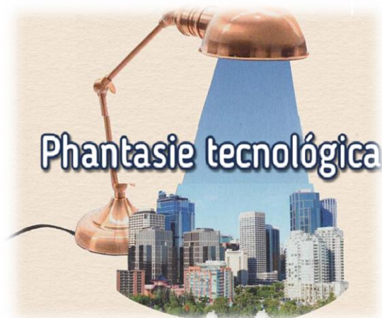
Figura 1. Phantasia Tecnológica

Obviamente que desde la modernidad a nuestros tiempos, mucho se ha avanzado en el conocimiento, pero desde aquellas épocas se mantiene el intento de combatir la equivocación, buscando la verdad objetiva. En palabras de Kant: eliminando el influjo de la sensibilidad acerca el entendimiento. Lo que implica desarrollar el juicio de manera tal de que no pueda ser seducido por los sentidos. Al respecto Kant (1978) el yo-pienso es la raíz del juicio del entendimiento ya que él mismo afirma que todos los fenómenos son ideas, la experiencia misma es un modo de conocimiento que exige entendimiento.