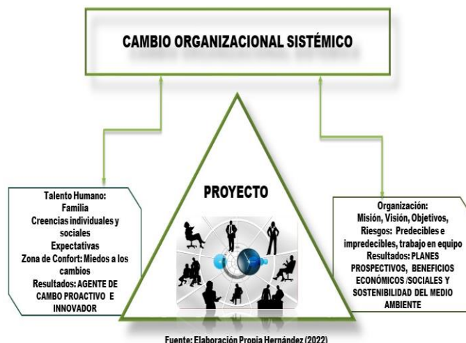
Figura 1. Cambio organizacional sistémico Fuente: Hernández (2022)

Tercero, el cambio debe ser concebido como un proyecto: el cambio de una organización responsable, debe contemplarse como un proyecto estratégico. Que determinarían las consecuencias a favor y cómo romper las barreras de los miedos de cada ser humano que pertenezca en dicha organización. En esta fase, se podrán aclarar todas las dudas acerca el talento humano, sus aspiraciones como parte de la organización, es decir, deberán contar con un entrenamiento para lograrlo. Impacto estratégico: el talento humano debe considerarse como un agente de cambio proactivo, crítico, dinámico e innovador.