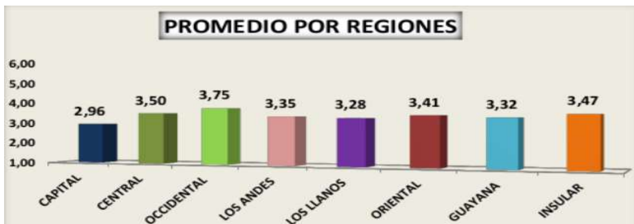
Figura 1: Diagnóstico Gestión del Sector Eléctrico Venezolano/Promedio por Regiones (2024).

En resumen, y de manera gráfica se presentan los resultados de la encuesta aplicada, donde se muestra la comparación entre el promedio de las regiones. Para ello previamente se graficó el promedio de las categorías estudiadas en cada una de las regiones por separado, y luego se calculó el promedio de cada región, entendiendo que el indicador mientras más se acerque al valor uno (1), la organización se muestra exitosa y efectiva en los diferentes ámbitos estudiados.