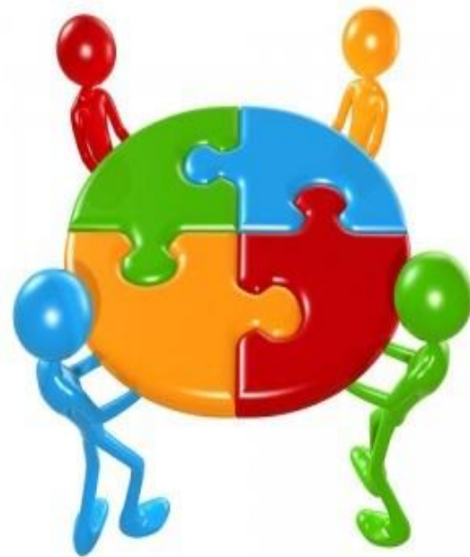
Imagen 2. Transdisciplinariedad

Legitimar o validar saberes populares. Involucrar a la academia en la búsqueda de soluciones de problemas que atañen a la sociedad". En síntesis, (estudiante 5) "Su problema es el problema de la vida y el vivir, la construcción del futuro y la búsqueda de soluciones a los problemas contemporáneos".